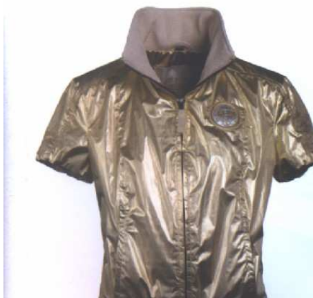
REDAKTION: MICHAELA SCHMIDINGER