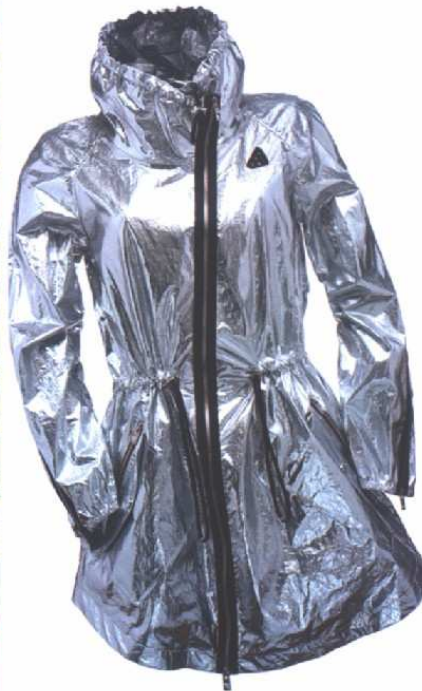
LINKS: SILBERNER PARKA MIT SCHWARZEM ASYMMETRISCHEM ZIPPER HOGAN RECHTS OBEN: BRONZE-FARBENE LANGJACKE BLAUER