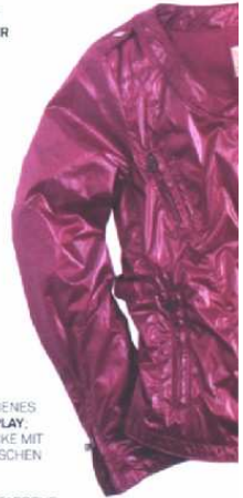
RECHTS: PINKFARBENES BIKER-JACKET REPLAY , ROSEFARBENE JACKE MIT AUFGESETZTEN TASCHEN PEUTEREY