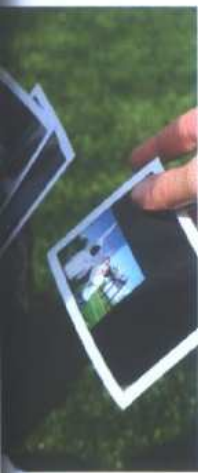
Achtung, fertig, los! Noch mehr Action für die Strellson-Boys. Auch das fertige Sujet sieht ganz fit aus.