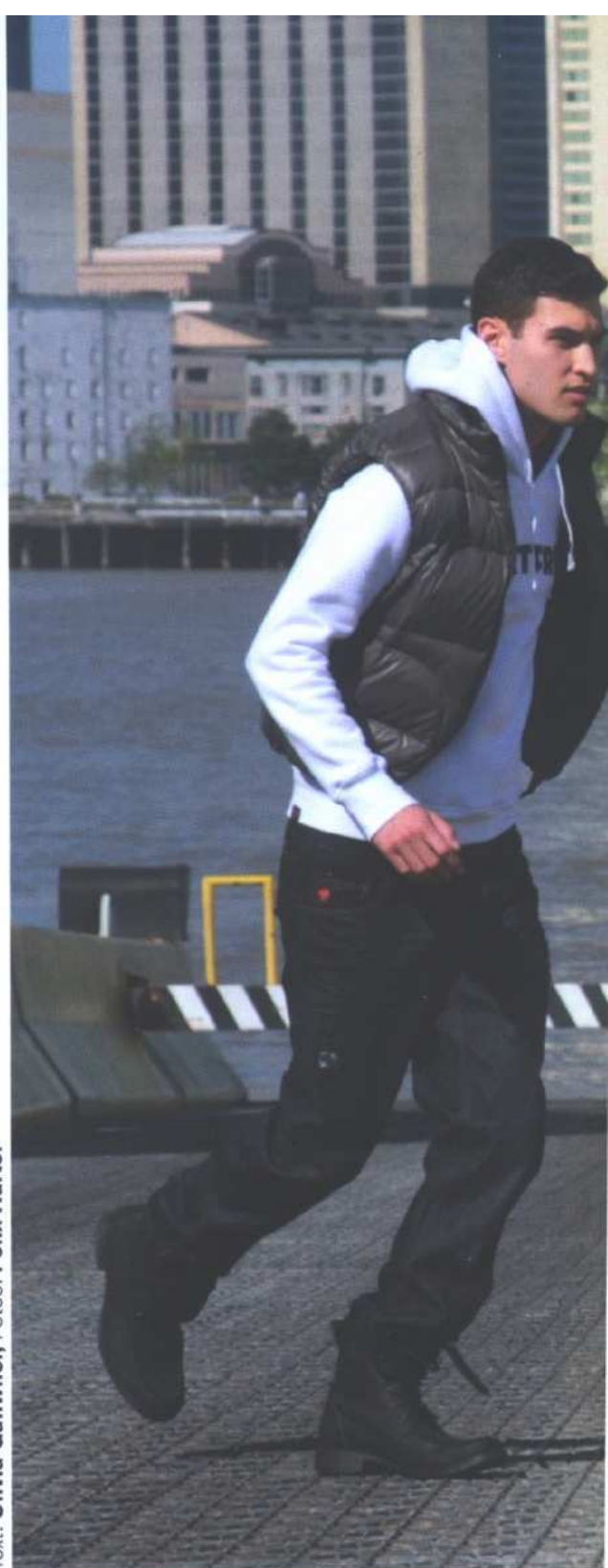
Kurze Atempause an Deck, schon posieren die Models am nächsten Set: einem Football-Platz.

Text: Olivia Gähwiler, Fotos: Felix Härtel