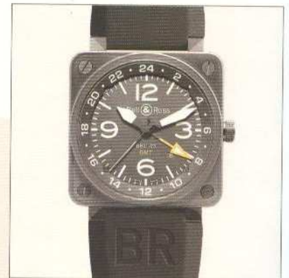
Bell & Ross, montre high-tech Grand Voyageur.