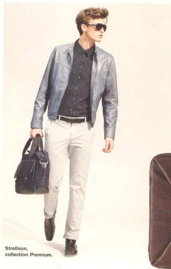
Strellson, collection Premium.

-/ The travelling man is right on time with Bell & Ross – preferably the watch for the long-haul traveller, one of the brand's classics. This high-precision instrument has a second time zone function, displaying the time at two different points of the globe simultaneously.