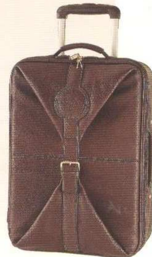
Lancel 1876, valise en cuir végétal.