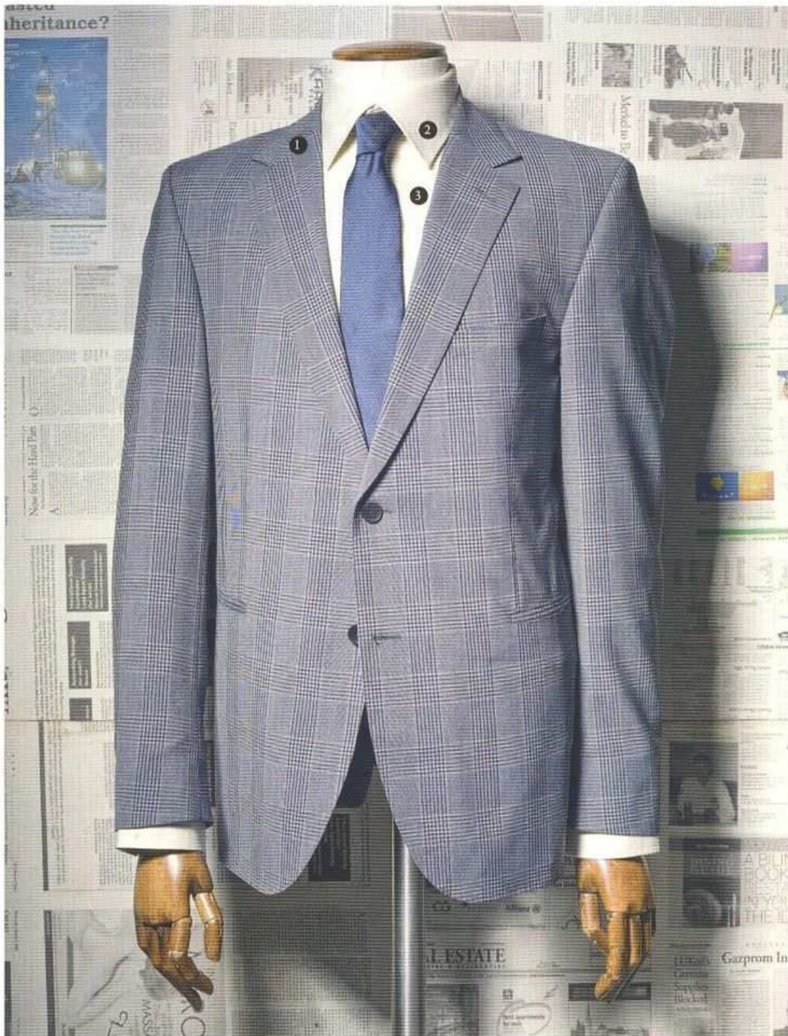
❶ Пиджак из шерсти с хлопком, STRELLSON ❷ Рубашка из хлопка, EINHORN ❸ Галстук из шелка, DIOR HOMME