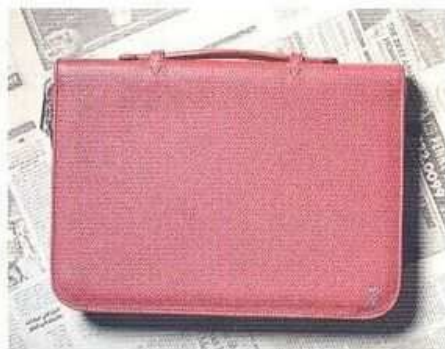
Патка для компьютера, SUTOR MANTELLASSI