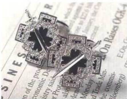
Запонки «Лед и пламень», золото, бриллианты, GOURJI