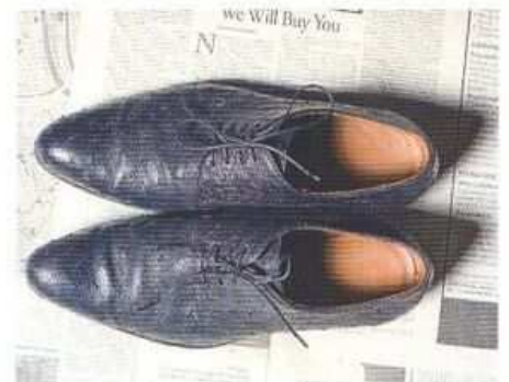
Ботинки из кожи страуса, BOSS BLACK