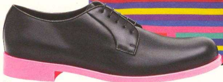
Halbschuh von Jil Sander aus Kalbsleder mit lasierter Sohle, 575 Euro