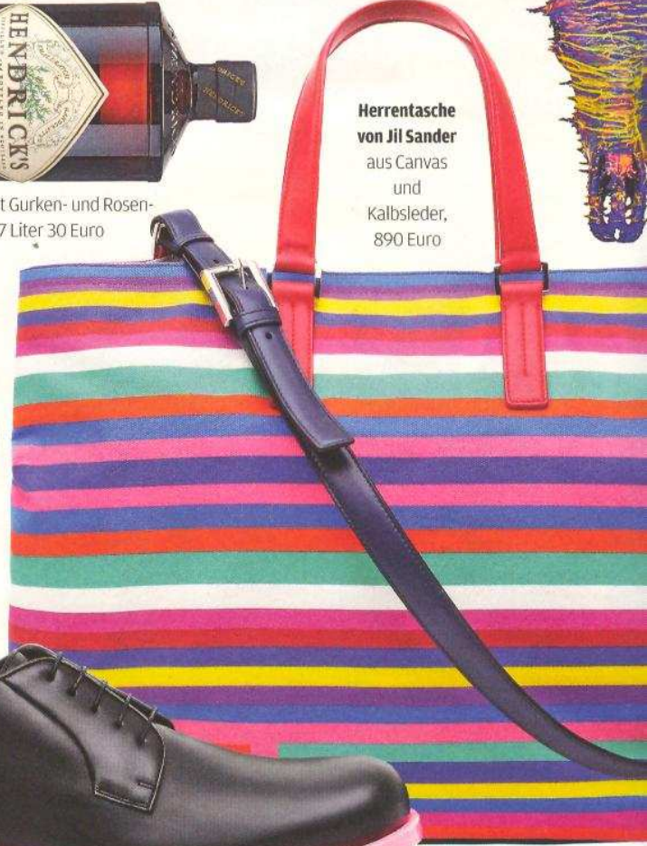
Herrentasche von Jil Sander aus Canvas und Kalbsleder, 890 Euro