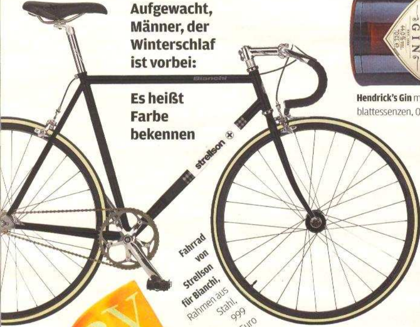
Fahrrad von Strellson für Bianchi, Rahmen aus Stahl, 999 Euro